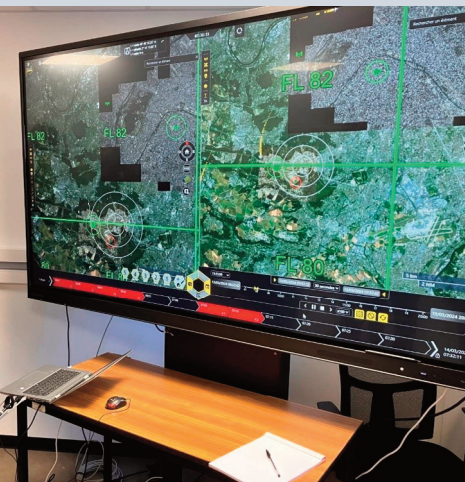
Visualisation SAP lors de l'exercice COUBERTIN LAD.

Le système SAP ayant répondu aux attentes de l'Armée de l'Air et de l'Espace, celle-ci a décidé de pérenniser son utilisation au sein des forces. SAP est donc actuellement dans une phase d'industrialisation, DIAMOND demeurant son cœur de fusion.